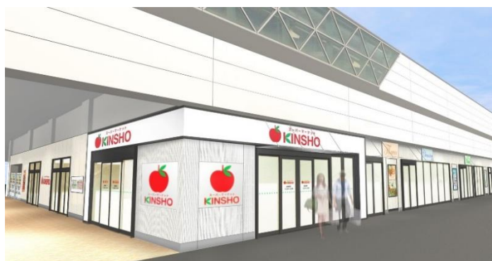
【店舗外観イメージ】