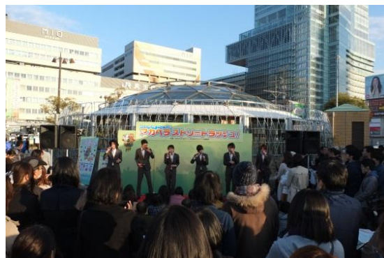
2016年3月 てんしばでのアカペラライブの様子