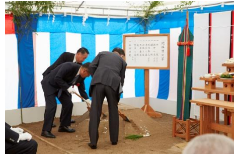
【穿ち初めの儀を行う共同事業主】