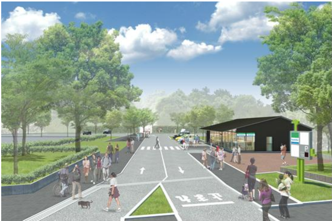
【茶臼山エントランスエリアCG】

真田幸村ゆかりの地、天王寺公園内にある茶臼山史跡周辺が改修工事を経て、3月19日（土）にリニューアルオープンします。当社が昨年10月より、天王寺公園エントランスエリア「てんしば」と共に大阪市から運営管理を受託している「茶臼山エントランスエリア」の遊歩道とも直結され、さらなる賑わいの創出が期待されます。そのオープンを記念して同エリアにて、「真田幸村本陣歴史トークショー」など、幸村を「楽しむ・感じる・学ぶ」イベントを開催します。なお、本イベントは天王寺区役所、天王寺観光協議会との共同開催です。また、本件につきましては、本日同時に大阪市からも報道発表されております。詳細については、別紙のとおりです。