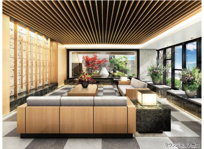
ラウンジ完成予想図