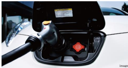
電気自動車専用の充電コンセントをご用意 電気自動車対応