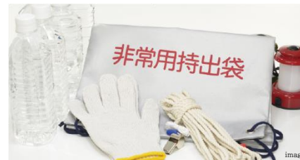
万が一の災害に備え防災備品を準備 防災備蓄倉庫