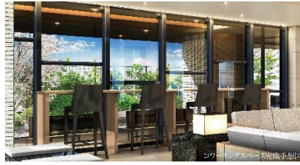
仕事や気分転換に最適な充実の共用部 Wi-Fi完備のコワーキングスペース