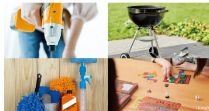
工具やアウトドア用品・パーティーグッズなどを貸し出し 備品貸し出しサービス