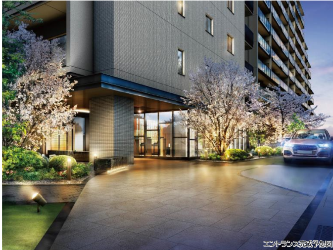
エントランス完成予想図

優美な佇まいが住まう方の誇りとなる 車寄せを設けたホテルライクな「エントランス」