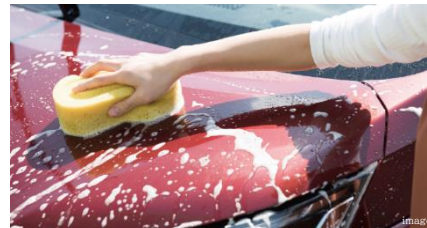
愛車の洗浄やワックス掛けなどを気軽に行える 洗車場