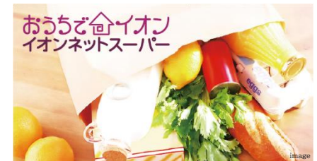
不在時はマンションに留置可能な食品配達サービス 食配ラボ(宅配ボックス型)