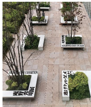
【16階屋外庭園 イメージ】

あべのハルカス美術館のある16階屋外庭園のベンチに、庵野秀明氏の関連作品である『ふしぎの海のナディア』や「エヴァンゲリオン」シリーズ、『シン・ウルトラマン』などの名台詞やキーワードを装飾いたします。17階ロビーからもお楽しみいただけます。