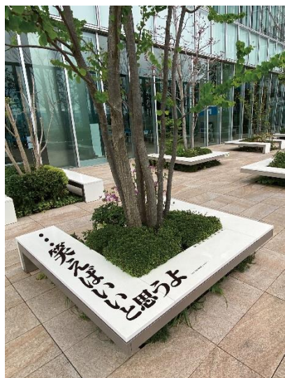
【16階屋外庭園 イメージ】