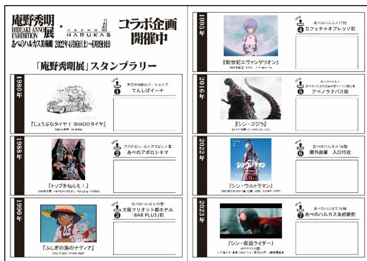
【スタンプラリー用紙 イメージ】