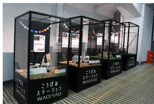
こうばのステーション WAO! YAO