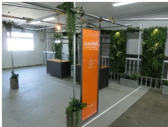
イベントスペース「HITONO-WA キユホ」