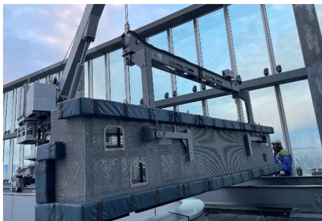
【地上300m！清掃 Gondola 体験ツアー（イメージ）】