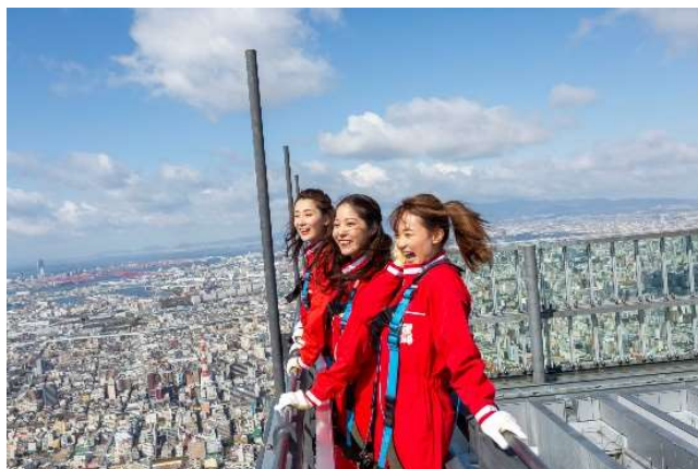
【エッジ・ザ・ハルカス 体験イメージ】

イベント②③の詳細につきましては、決定次第ハルカス300公式HPで改めて発表いたします。