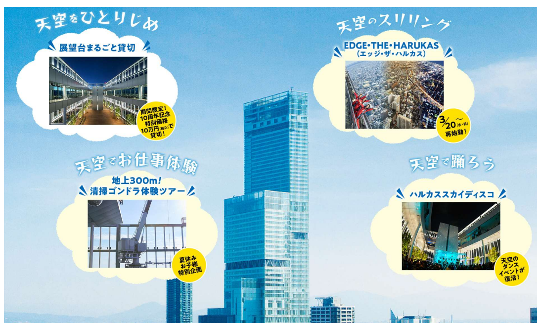
【『天空で遊ぼう』4つのイベント（イメージ）】

10周年を迎えるあべのハルカスの展望台「ハルカス300」では、10年間の感謝とともにこれからも皆さまに笑顔と元気をお届けできるような様々なイベントを実施してまいりたいと考えています。 詳細は別紙をご参照ください。