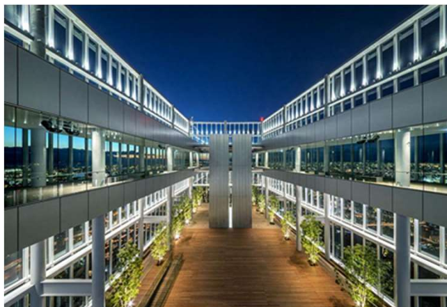
【展望台まるごと貸切（イメージ）】