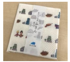
【あべのハルカス美術館 オリジナルふきん】

10周年を迎える3月7日(木)当日に「円空一旅して、彫って、祈ってー」にご来館のお客様にもれなく10周年を機に製作した「あべのハルカス美術館オリジナルふきん」をお1人様につき1枚、プレゼントいたします。