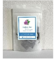
【マジックハーブ「マローブルー」】

■青く煌めくマジックハーブ「マローブルー」 600円(税込) お湯を注ぐと美術館ロゴのブランドカラーの鮮やかなブルーに染まります。 ご自宅で展覧会を振り返りながらほっとひと息。 見て楽しい、飲んでおいしい、不思議なハーブティーをお楽しみください。