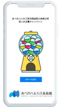
【デジタルガチャイメージ】