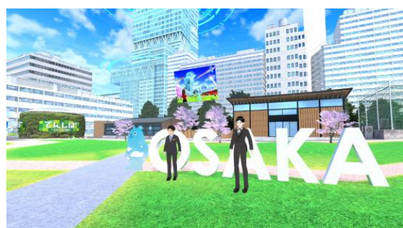
【バーチャルあべのハルカス内イメージ図】