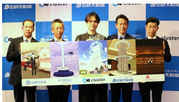
【完成発表会集合写真】

バーチャルあべのハルカスおよびオープニングイベントの詳細は別紙をご参照ください。