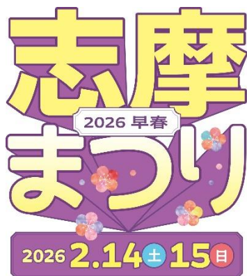
【志摩まつり2026早春キービジュアル】