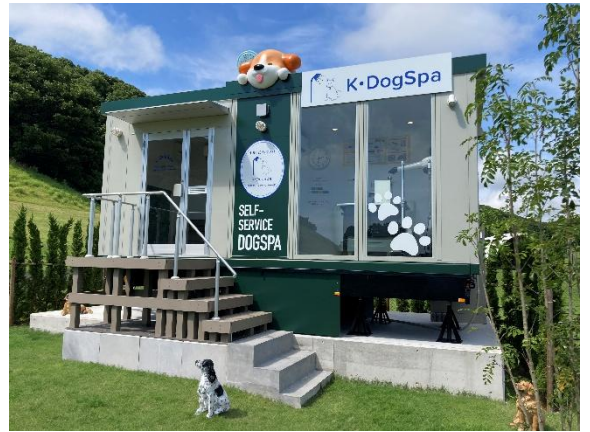
【K・DogSpa 志摩グリーンアドベンチャー店】

宿泊のご利用者様にはシャンプー・タオルの専用アメニティ（本イベントの参加特典の一部）のプレゼントもあり、ドッグランや、特製ごはんメニューなどと並び、ペットという家族との最高の宿泊体験をご提供するための施設です。