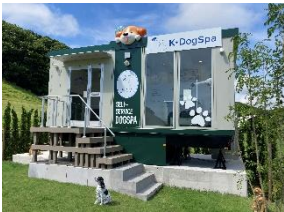
【K・DogSpa 志摩グリーンアドベンチャー店】