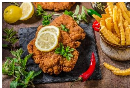
【クリスマスマーケット料理 イメージ】