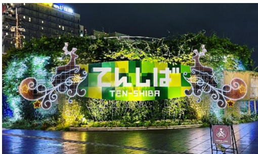
【クリスマス装飾 イメージ】

ご家族やご友人、大切な人と、クリスマスの雰囲気あふれる「てんしば」へぜひお越しください。詳細については、別紙のとおりです。