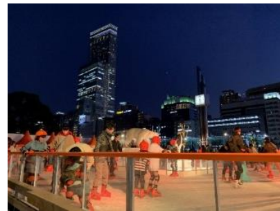
【てんスケ 前回開催時】