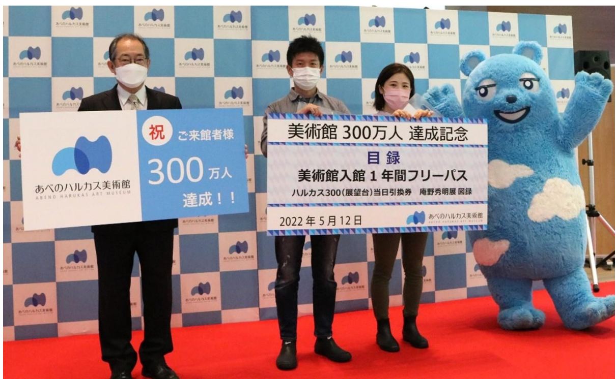
ご来館者300万人達成セレモニーの様子

本日実施した「ご来館300万人達成記念セレモニー」および記念抽選会、記念回数カードの概要は、別紙のとおりです。