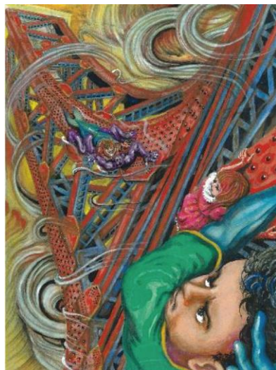
《ZOKU-SHINGO 小さなロボット シンゴ美術館》(部分) 楳図かずお 2021年 ©楳図かずお