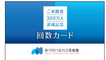
回数カードイメージ