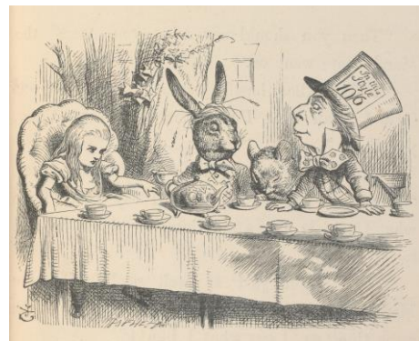
ジョン・テニエル《マッド・ハッターのお茶会でのアリス》(『不思議の国のアリス』初刊行版本より) 1866年 V&A内ナショナル・アート図書館蔵