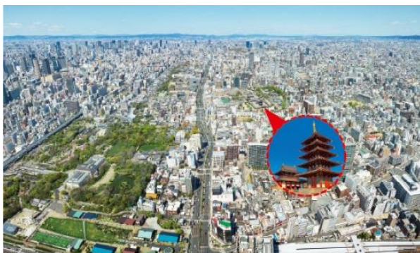
【ハルカス300（展望台）から望む四天王寺 イメージ】

本イベントを通して、近鉄グループ、四天王寺や地域を支える自治体等が連携し、見て、聴いて、遊んで、学べる聖徳太子の歴史と地域資源を活用した魅力を、より多くの方々に発信できるよう運営してまいります。