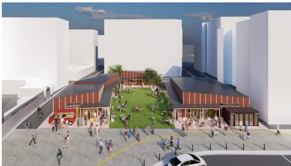
【新規商業施設の完成イメージ】

今回の取り組みは、以下の観点でSDGsに貢献します。 ・豊かな暮らしを支える持続的な沿線活性化への貢献 （11. 住み続けられるまちづくりを）