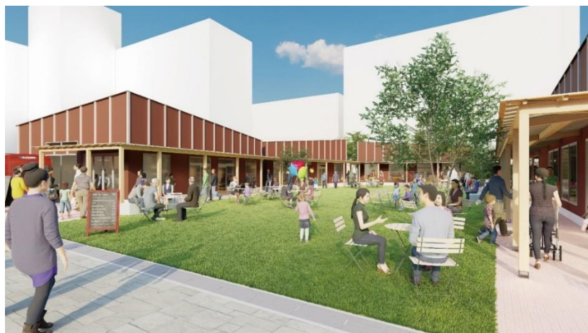
【新規商業施設の完成イメージ】