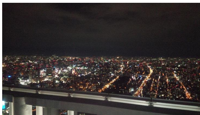
ヘリポートからの夜景