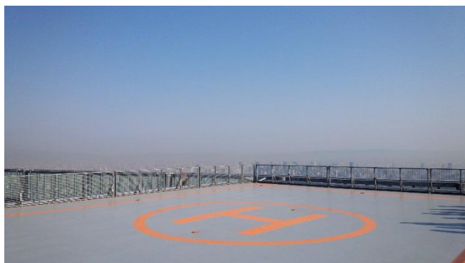
ヘリポートからの眺望

今後もあべのハルカスでは、多くのお客様にご満足いただける各種サービスを実施してまいります。