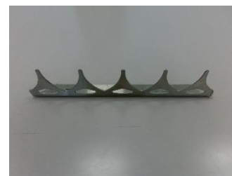
外周柵への忍び返し