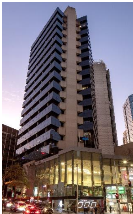
【「60 Margaret Street」施設外観】