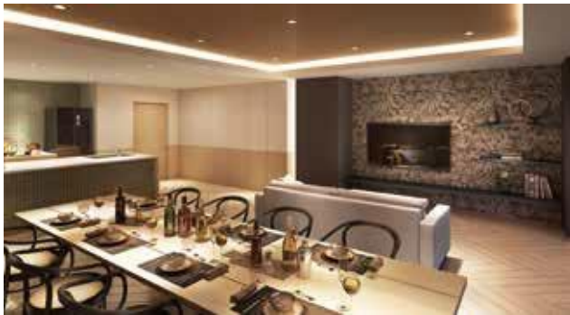
「パーティサロンワンダー」完成予想図