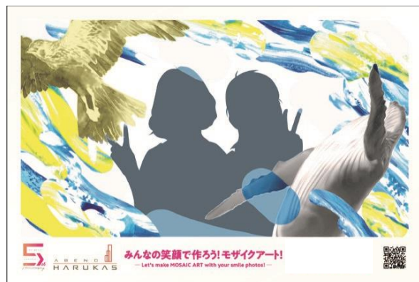
【写真台紙イメージ（はずれ）】