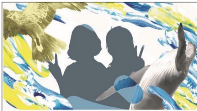
【写真フレーム（イメージ）】