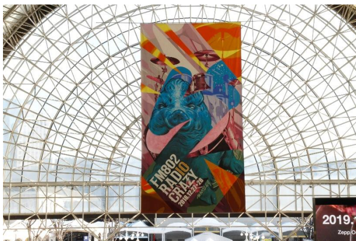
【代表作名 FM802 ROCK FESTIVAL RADIO CRAZY の巨大バナー】

一人では創れない作品を通じて、絵のある暮らしを日常にもたらし、気の合う仲間と日々を彩っていくライフスタイルを提案する。