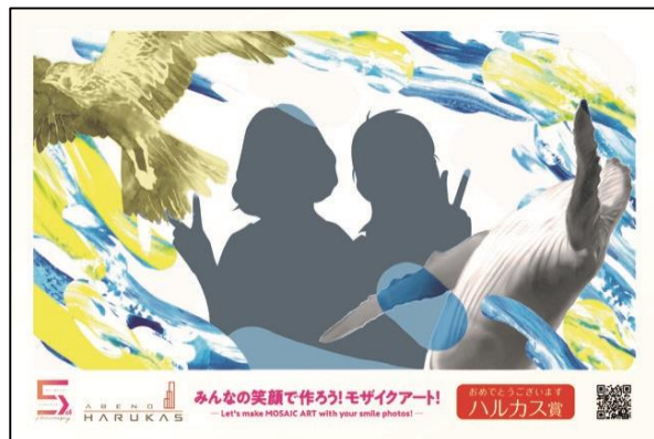
【写真台紙イメージ（当たり）】