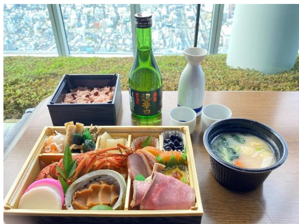
【「プレミアムプラン」おせち料理】