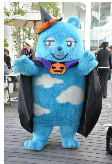
あべのべあ賞 受賞作品 うさぎうま 様