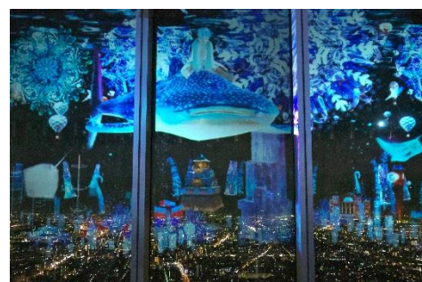
海遊館賞 受賞作品 川崎豊子 様