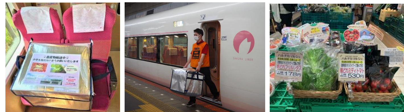
「さくらライナー」での貨客混載輸送と「ハルチカマルシェ」での販売の様子（イメージ）