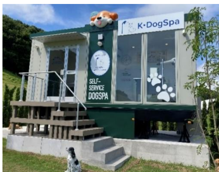
【K・DogSpa 志摩グリーンアドベンチャー店】