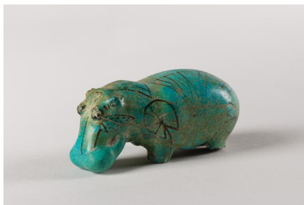
《カバの像》前1938～前1539年頃