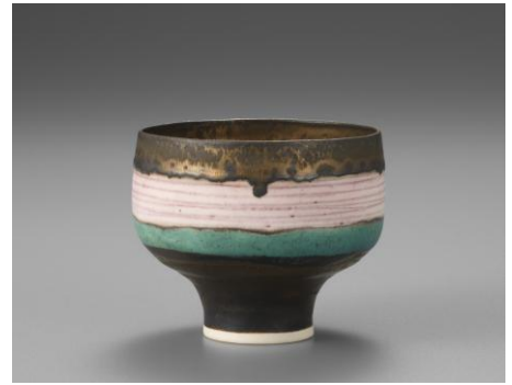
ルーシー・リー《ピンク象嵌小鉢》1975-79年頃 国立工芸館蔵