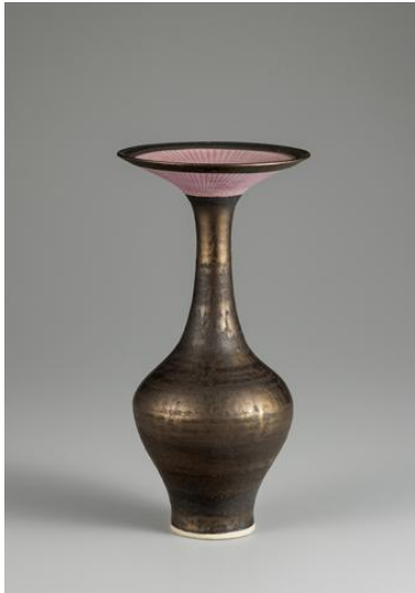
ルーシー・リー《ブロンズ釉花器》1980年頃 井内コレクション(国立工芸館寄託)