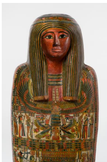
《神官ホル(ホルス)のカルトナーージュとミイラ》(部分) 前760～前558年頃

会期：2026年3月20日(金・祝)～2026年6月14日(日) 共催：ブルックリン博物館、朝日新聞社、東映、読売テレビ 協賛：DNP大日本印刷 協力：名古屋大学、日本航空、一般社団法人Platoo、ヤマト運輸、World Scan Project 企画協力：日本テレビ放送網 開催趣旨：彫刻、棺、宝飾品、陶器、土器、パピルス、そして人間やネコのミイラなど約150点の遺物を通じて、私たちの想像を超える高度な文化を創出した人々の営みをひも解きます。「知っているようで知らない事実」から最新技術を使ったピラミッド研究まで、映像や音声も交えて紹介します。