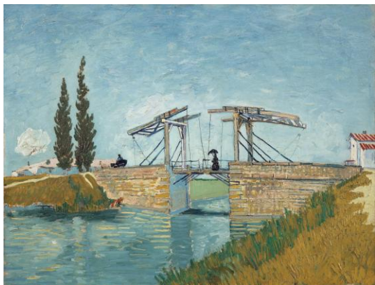
フィンセント・ファン・ゴッホ《跳ね橋》1888年 油彩、カンヴァス Vincent van Gogh, The Drawbridge, 1888, Oil on canvas

開催趣旨：ドイツ、ケルン市のヴァルラフ＝リヒャルトツ美術館・コルプー財団が所蔵する豊かなコレクションから、モネ、ルノワール、ピサロほか印象派をめぐる42名の巨匠たちの作品70点を紹介します。とりわけ、印象派以降の流れのなかでも際立つ存在であるゴッホの《跳ね橋》が本展の見どころの一つです。