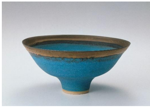
ルーシー・リー《青釉鉢》1978年 国立工芸館蔵