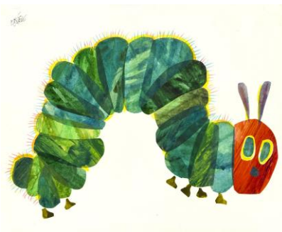
③エリック・カール『はらぺこあおむし』1987年版 表紙 1987年、エリック・カール絵本美術館 Collection of the Eric and Barbara Carle Foundation.

※上記①～③の画像データは貸出が可能です。ご希望の方はお問合せください。また、事前に原稿の確認が必要になります。（画像の使用は、本展覧会をご紹介いただく媒体に限ります。ご使用後は破棄をお願いします。）