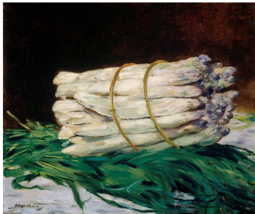
エドゥアール・マネ《アスパラガスの束》1880年 油彩、カンヴァス Edouard Manet, A Bunch of Asparagus, 1880, Oil on canvas

作品はすべてヴァルラフ＝リヒャルトツ美術館・コルプー財団蔵 Wallraf-Richartz-Museum & Fondation Corboud, Cologne