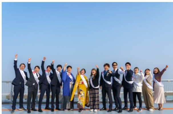
【ヘリポート記念撮影の様子】 （第9回ハルカスウォーク）