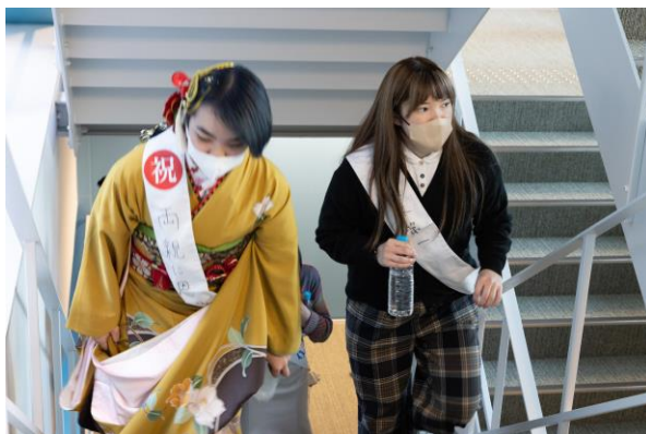
【階段を登る様子】 （第9回ハルカスウォーク）