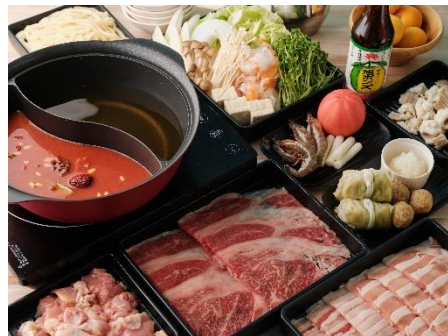
【黒毛和牛&茶美豚&備中高原鶏<Premium> 選べるスープしゃぶしゃぶ鍋】 ※写真のスープは極だしとトマト麻辣湯です。