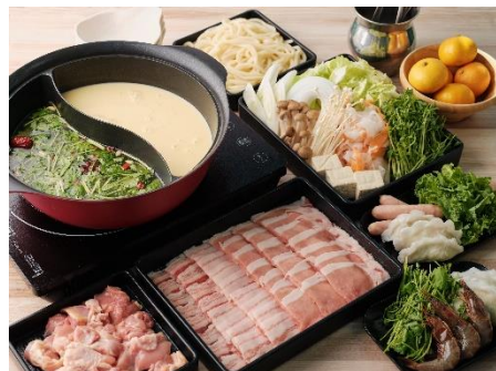
【茶美豚&備中高原鶏 選べるスープしゃぶしゃぶ鍋】 ※写真のスープはコーンポタージュとパクチー&薬膳です。