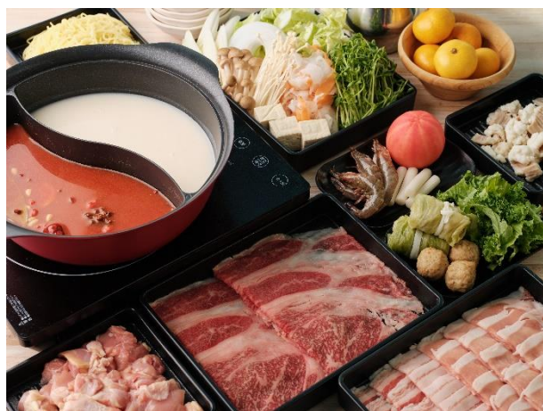
【黒毛和牛&茶美豚&備中高原鶏<Premium> 選べるスープしゃぶしゃぶ鍋】（イメージ）

今年の冬も、心と体が温まる『かこむ de こたつ』で素敵なひとときをお過ごしください。 詳細については、別紙をご覧ください。