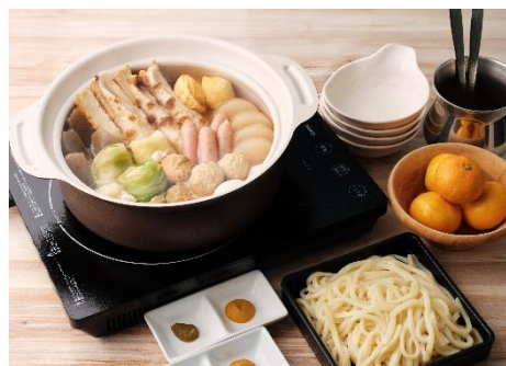
【極だし おでんセット】