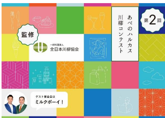
【あべのハルカス川柳コンテスト メインビジュアル】

「あべのハルカス川柳コンテスト」は川柳をつくったことがない方でも楽しんでいただける内容となっています。皆さまからのご応募を心よりお待ちしております。