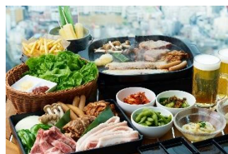
ハルカス300【食べるで↑ BBQ(カジュアルプラン)】