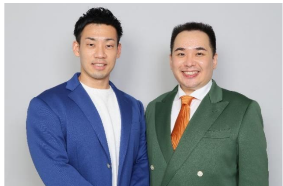
【ゲスト審査員 ミルクボーイ】