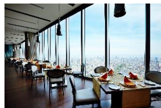
マリオット都ホテル【ZK】

※賞品をお選びいただくことはできません。 ※賞品は8月末頃から順次発送する予定です。