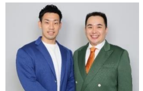
【ゲスト審査員 ミルクボーイ】