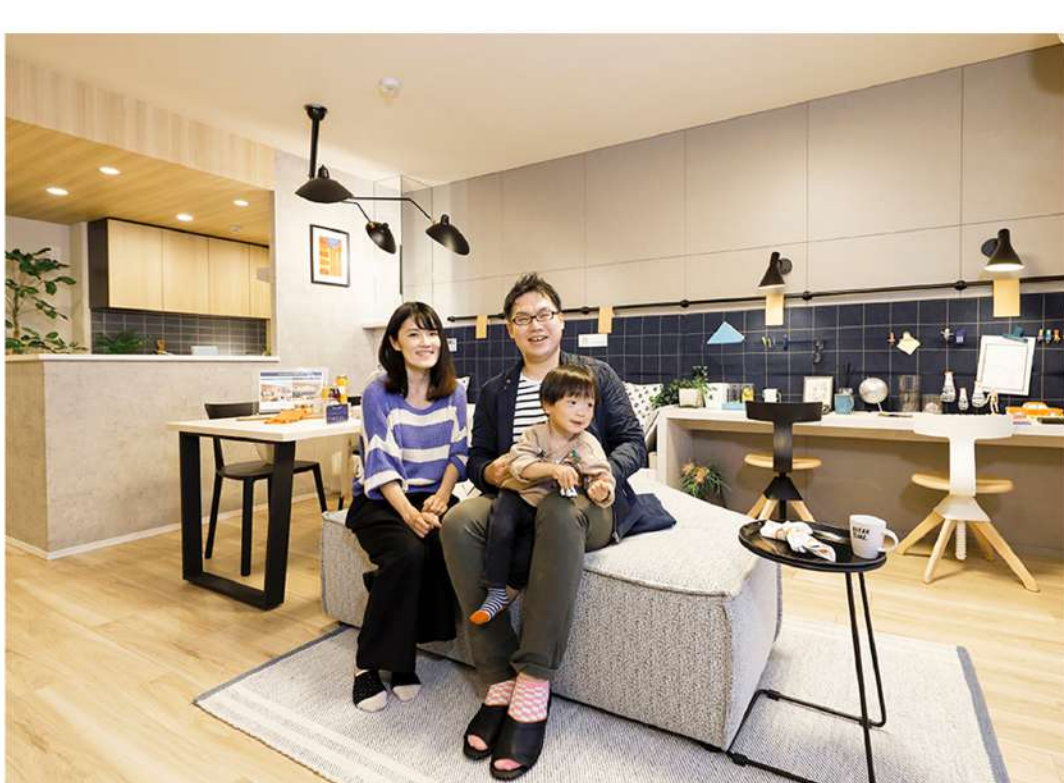
広々としたリビング・ダイニング ※1