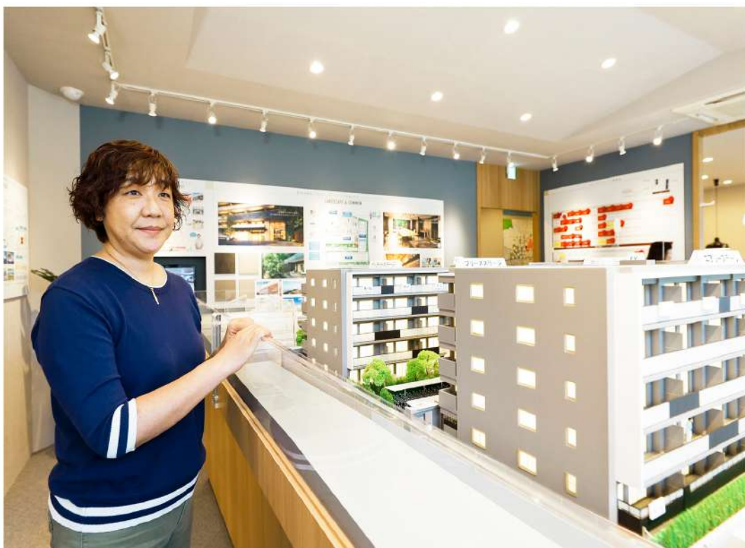
マンションギャラリー内