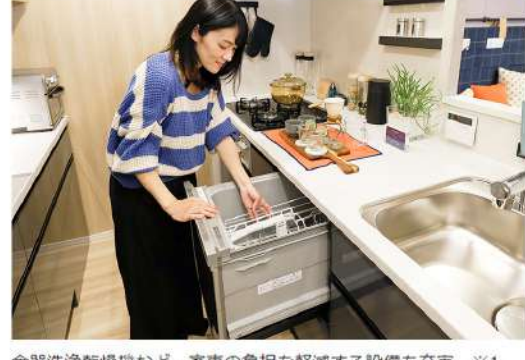
食器洗浄乾燥機など、家事の負担を軽減する設備も充実 ※1