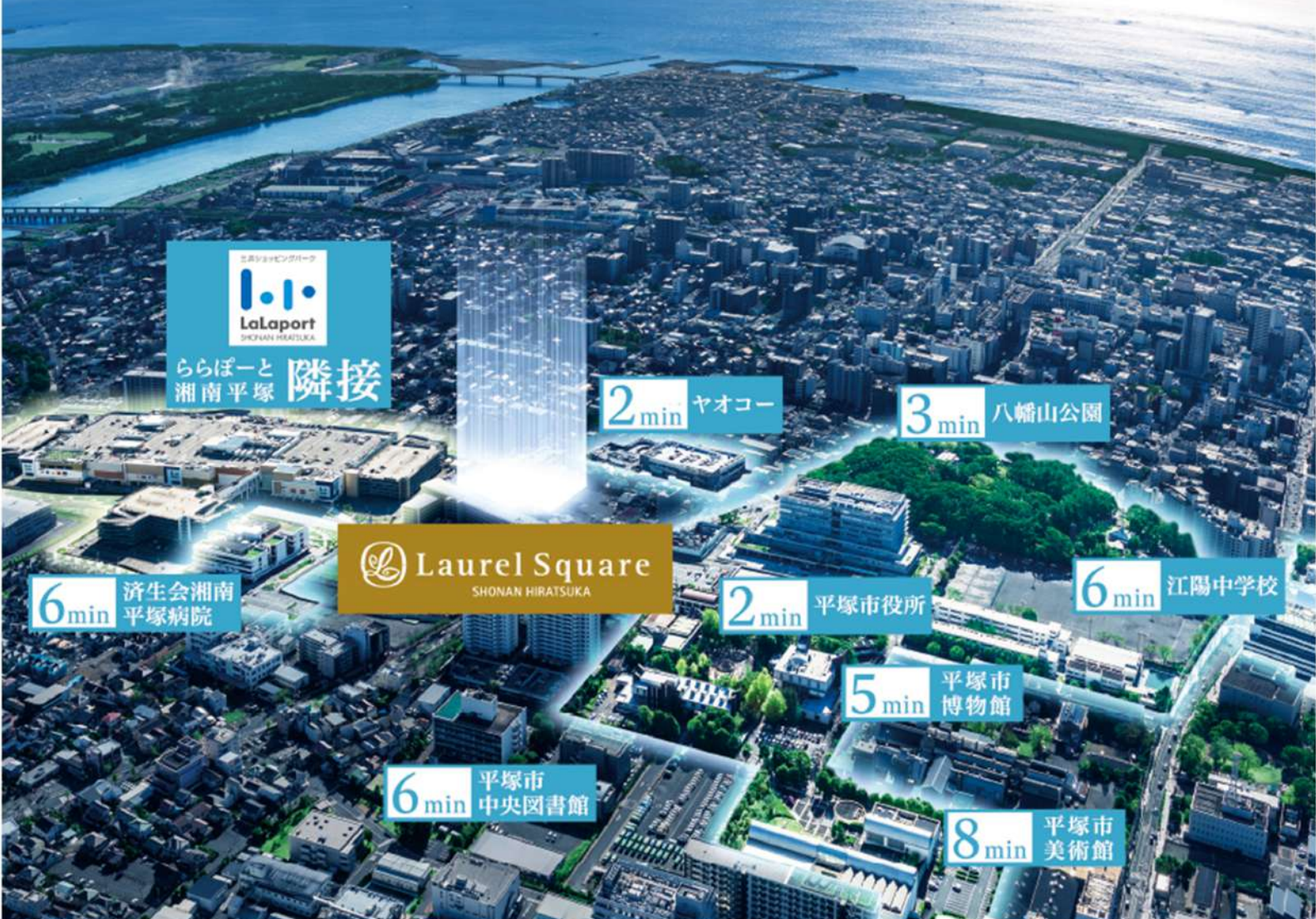
平塚の主要な施設が物件周辺に集まる (現地周辺の航空写真) ※3

自分は家で仕事をしていまして、家の周りに暮らしを充実させる施設が揃っていることはとても大事でした。この場所なら、少し出かければ買い物ができる、寛げる公園があり、図書館や美術館も利用できて……。平塚に暮らす親戚や友人に囲まれながら、便利に楽しく暮らす自分を想像することができました」