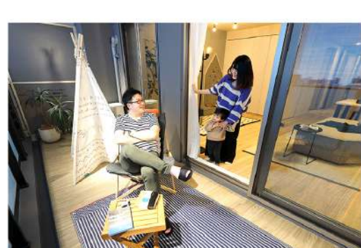
バルコニーは奥行きもあり、開放的な屋外空間を満喫することができる ※1