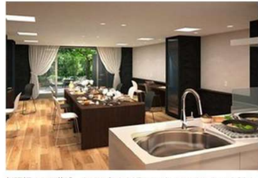
料理好きなS様が、多くの友人を迎えてパーティをしたいと話す「バーテラス」 ※2