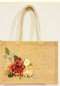
サイズ:約22cm×30cm×マチ11cm(持ち手を除く) ※写真はイメージです。