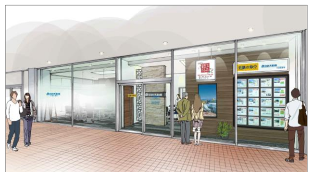
【店舗完成予想パース】