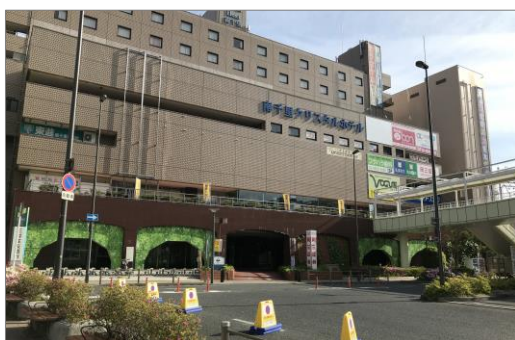
【店舗入居ビル 外観】