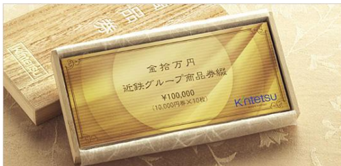
近鉄グループ商品券 7万円