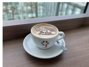
【縁起グルメ（カフェチャオブレッソ）】