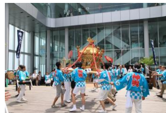
【阿倍王子神社「阿倍野神輿」巡業】