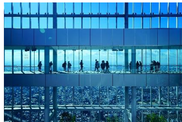
ハルカス300(展望台)ペアチケット