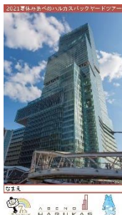
【学習の記録が残せるワークシート】

※本ツアーは、あべのハルカスの機械室等をご案内するツアーです。メンテナンス等により予告なくツアー行程を変更することがございます。あらかじめご了承ください。