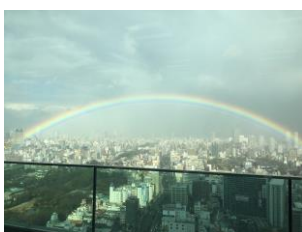
【ハルカスから見えた虹】