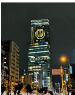
【7周年ライトアップ “Light of Rainbow”】