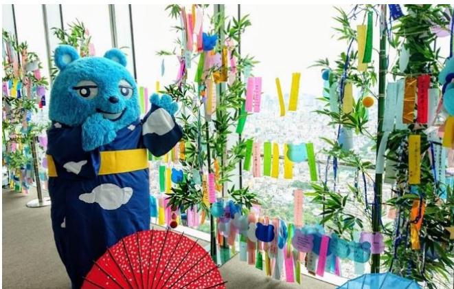
【昨年の七夕イベントの様子】