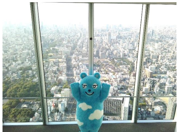
【「pictureFly」撮影写真 イメージ】