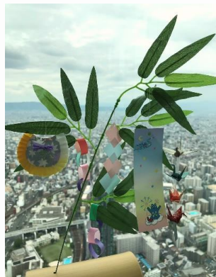
【ミニ笹ワークショップ（完成イメージ）】