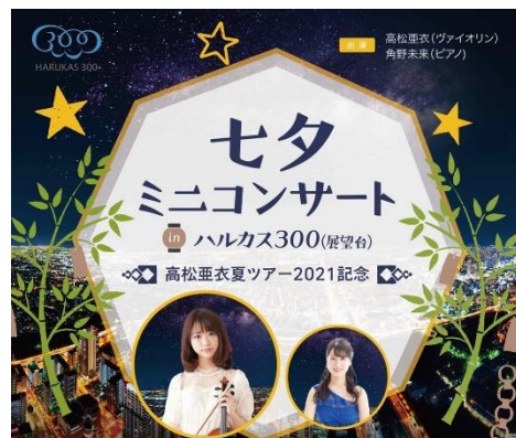
【コンサート(ポスターイメージ)】