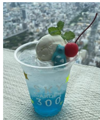
【七夕クリームソーダ】