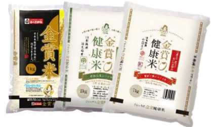
【米俵 イメージ画像】