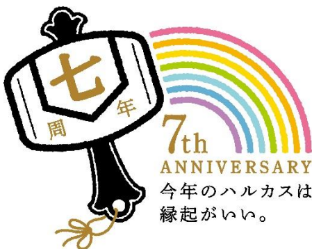
【7周年ロゴデザイン】

報道機関の取材については、個別にお受け致します。 下記までお問い合わせください。