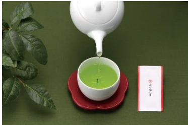
【茶柱縁起茶 イメージ画像】