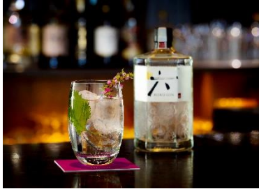
【七福ジントニック イメージ画像】