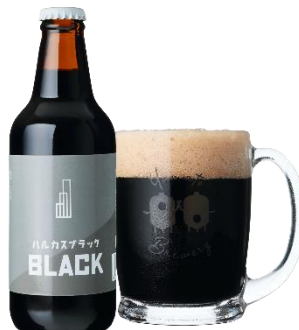
【ハルカスブラック】