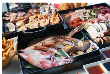
【「海鮮バーベキューメニュー」】

「秋色バーベキュー」と「海鮮バーベキュー」は事前予約制で、8月19日（月）14：00より予約受付を開始します。詳細については別紙をご覧ください。