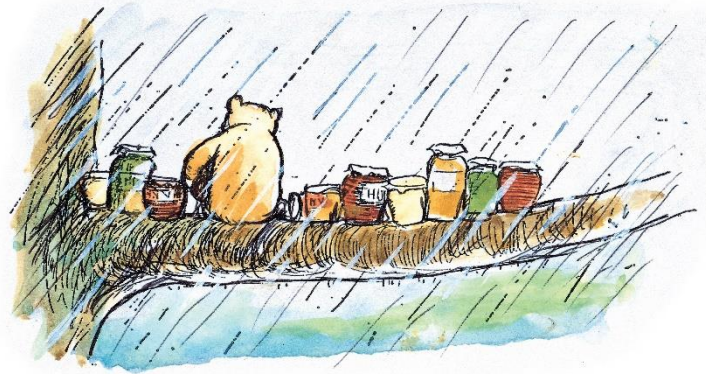
「枝には、ハチミツのつぼが10ならんでいて、そのまんなか、プーが…」、 『クマのプーさん』第9章、E.H.シェパード、ラインブロックプリント・手彩色、 1970年 英国エグモント社所蔵© E H Shepard colouring 1970 and 1973 © Ernest H. Shepard and Egmont UK Limited