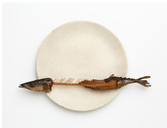
前原冬樹《一刻：皿に秋刀魚》桜、油彩