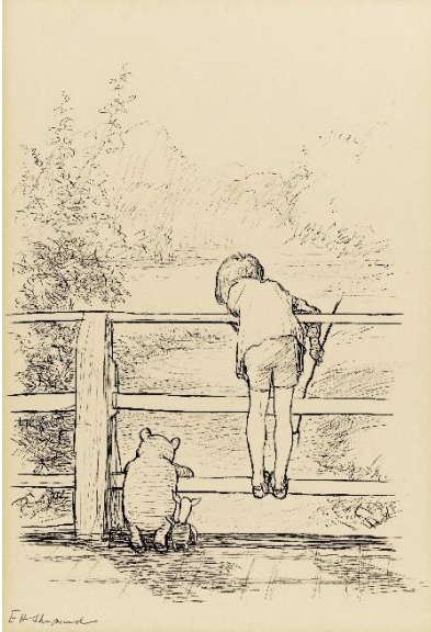
「ながいあいだ、三人はだまって、下を流れてゆく川をながめていました」、 『プー横丁にたった家』第6章、 E.H.シェパード、鉛筆画、1928年、ジェームス・デュボース・コレクション © The Shepard Trust

開催趣旨：『クマのプーさん』は1926年に出版されて以降、50以上の言語に翻訳され、5000万部以上のシリーズ本が出版されています。この展覧会は、著者A.A.ミルンと挿絵を担当したE.H.シェパードの貴重な作品とともに、英国ヴィクトリア・アンド・アルバート博物館をはじめ各国から集めた資料により、世界中で愛される「クマのプーさん」のすべてを紹介する決定版の展覧会です。