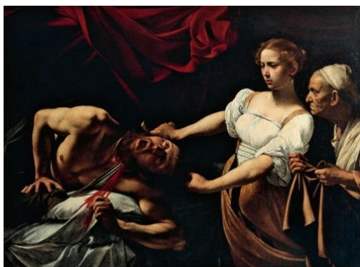
《ホロフェルネスの首を斬るユディト》ミケランジェロ・メリージ・ダ・カラヴァッジョ 1599年頃 バルベリーニ宮国立古典美術館 per concessione del Ministero dei Beni e delle Attività Culturali e del Turismo

開催趣旨：17世紀バロック絵画の創始者で、イタリアが誇る天才画家、ミケランジェロ・メリージ・ダ・カラヴァッジョ (1571-1610)。光と闇の交錯する劇的な絵画空間、迫真的な描写は多くの追隨者を生み出した。その栄光とは裏腹に、破滅的な人生が伝説ともなりました。わずか60点強とされる現存作品の中から、日本初公開を含む約10点と、彼に影響を受けた画家たちの作品が一堂に集結します。