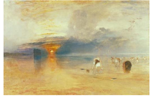
《カレの砂浜 ―― 引き潮時の餌採り》 ジョゼフ・マロード・ウィリアム・ターナー ベリ美術館 J. M. W. Turner, Calais Sands at Low Water: Poissards Collecting Bait, 1830, Oil on canvas, 68.6 x 105.5 cm, Bury Art Museum, Greater Manchester, U.K.