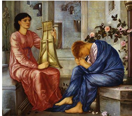
《嘆きの歌》エドワード・バーン＝ジョーンズ 1865-66年 ウィリアム・モリス・ギャラリー Edward Burne-Jones, The Lament, 1865-66, Watercolour and bodycolour, on paper laid down on canvas, 47.5 x 79.5 cm, William Morris Gallery