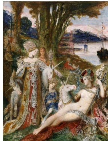
《一角獣》 ギュスターヴ・モロー 1885年頃 ギュスターヴ・モロー美術館