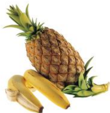
《パイナップル、バナナ》安藤緑山 清水三年坂美術館

開催趣旨：本物と見まがう野菜や果物、自在に動く動物や昆虫、精緻な装飾や細かなパーツで表現された器やオブジェ…。近年注目の高まる明治工芸と、そのDNAを受け継ぐ現代の作家たちによる超絶技巧の競演をご覧ください。人間の手が生み出す奇跡のような技術に加え、洗練された造形センスと機知に富んだ、驚異の美の世界をお楽しみください。