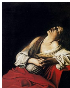
《マグダラのマリア》 1606年 個人蔵