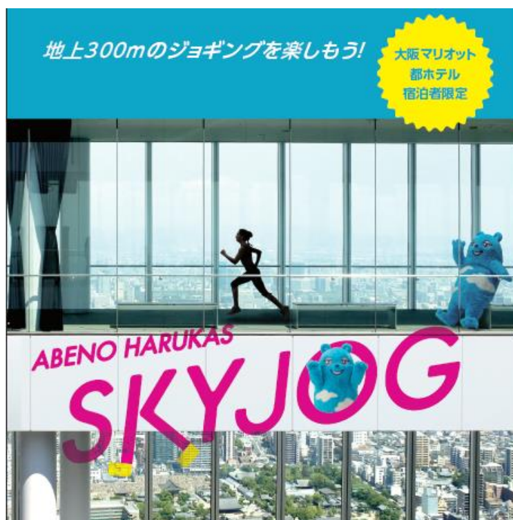
『ABENO HARUKAS SKY JOG』イメージ図

ぜひ、「地上300mのジョギングコース」で日常では味わうことのできない体験をお楽しみください。詳細は別紙をご覧ください。