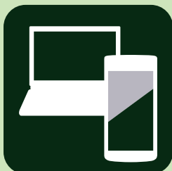
オンライン接客の実施