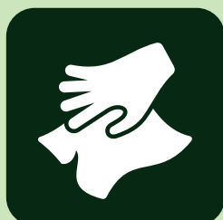
アルコールの除菌清掃