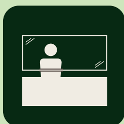
飛沫シールドの設置