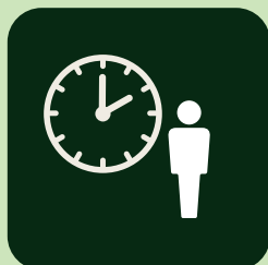
予約制での個別ご案内