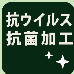
抗ウイルス・抗菌加工

新型コロナウイルス感染・拡大防止のため、ご来場のお客様およびスタッフの安全を第一に考え、様々な対策を実施しております。ご理解とご協力をお願いいたします。