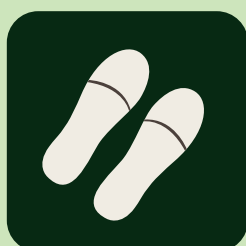
使い捨てスリッパの使用