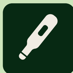
スタッフの検温実施