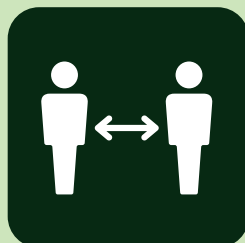
ソーシャルディスタンスの確保