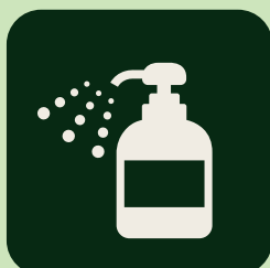
手指用消毒液の設置