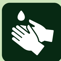
スタッフの手洗い・うがい