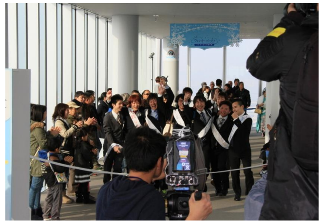
ゴールする新成人 （第3回ハルカスウォーク）

本資料配布先：大阪建設記者クラブ、青灯クラブ、近畿電鉄記者クラブ、南大阪記者クラブ、関西レジャー記者クラブ