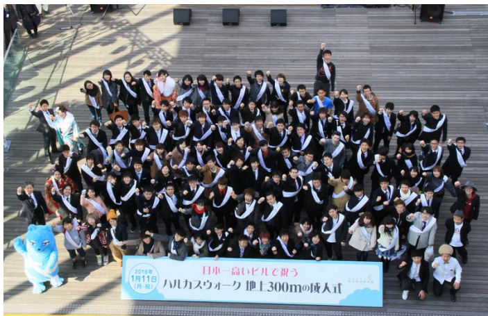
参加者の記念撮影の様子 （第3回ハルカスウォーク）