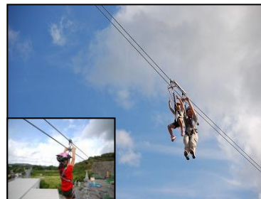
ジップライン滑走 イメージ写真