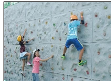
ミニボルダリング イメージ写真

本資料配布先：大阪建設記者クラブ、青灯クラブ、近畿電鉄記者クラブ、南大阪記者クラブ、関西レジャー記者クラブ