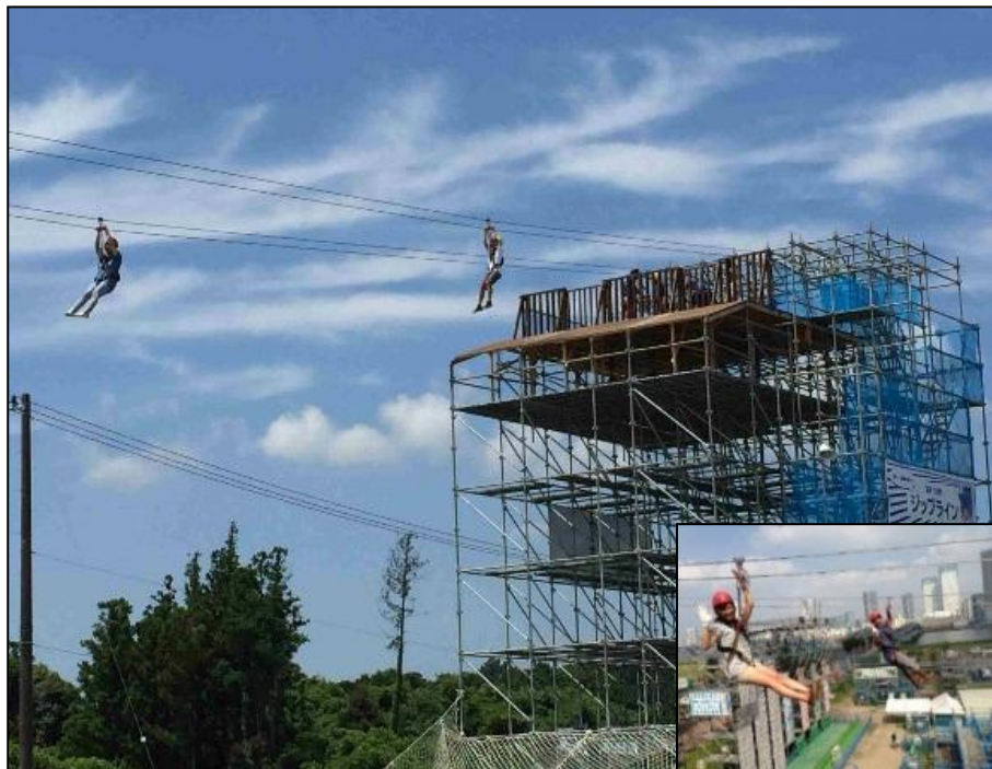
ジップラインスタート台 イメージ写真