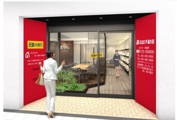
あべの営業所 完成予想パース

名称： 近鉄の仲介 あべの営業所 所在地： 大阪市阿倍野区阿倍野筋1-45-7（地番） 交通： 近鉄南大阪線「大阪阿部野橋」駅 徒歩2分 大阪市営地下鉄各線「天王寺」駅 徒歩2分 JR各線「天王寺」駅 徒歩3分 営業開始日： 2016年3月12日（土） 営業時間： 9:30~18:20 定休日： 水曜日および第2・3木曜日 問合せ： TEL：06-6627-0032 FAX：06-6627-0036 7-11：0120-977-606 E-mail：e-abeno@kintetsu-re.co.jp