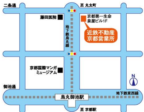
京都営業所 位置図