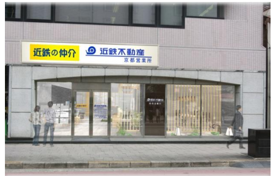
京都営業所 完成予想パース

名称： 近鉄の仲介 京都営業所 所在地： 京都市中京区烏丸通二条下る秋野々町513 （京都第一生命泉屋ビル1F） 交通： 京都市営地下鉄烏丸線・東西線 「烏丸御池」駅 徒歩3分 営業開始日： 2016年3月12日（土） 営業時間： 9:30~18:20 定休日： 水曜日および第2・3木曜日 問合せ： TEL：075-255-3133 FAX：075-255-3136 7-11：0120-911-809 E-mail：e-kyoto@kintetsu-re.co.jp