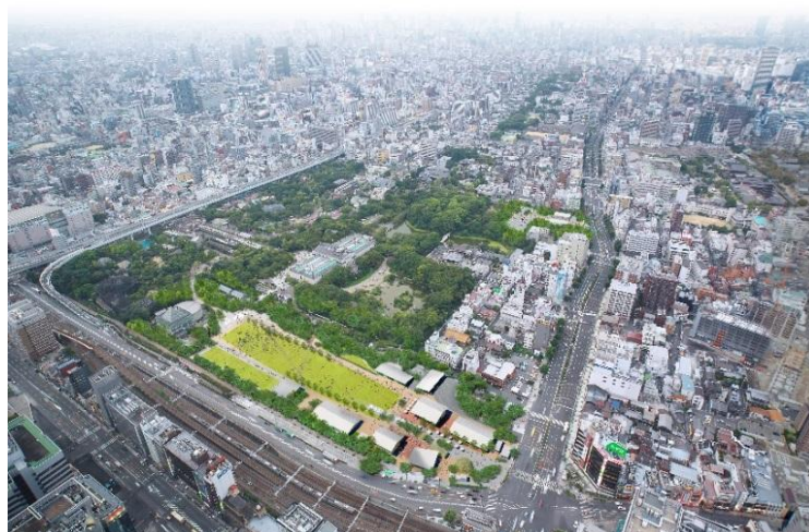
全景(あべのハルカス「ハルカス300(展望台)」から撮影) ※芝生広場はCGによる合成