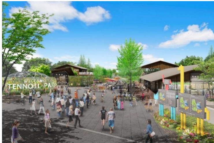
エントランスエリア完成予想CG(東側)