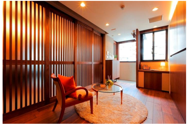
格子戸を閉めた状態のプラスワンルーム