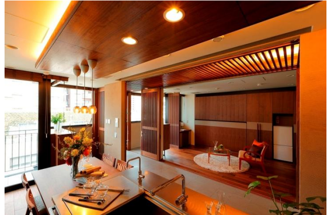
メインルームから見た、格子戸を開放した状態のプラスワンルームと土間空間