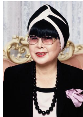
YUMI KATSURA Paris