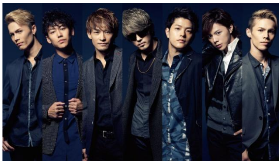
ダンス・ボーカルグループ「BRIDGET」

また、8月1日に開催された桂由美ブライダルファッションショー「Tokai Bridal FES 2015」にゲスト出演し、10月7日にシングルとしてリリースする桂由美監修、全日本ブライダル協会推奨、恋人の聖地公式ウエディングソング「君だけ愛してる」を初披露した。