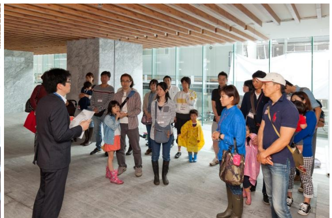
共用施設のご案内