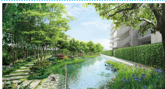
ビオトープのあるふれあいの森イメージ図

当物件の植栽計画は、港北ニュータウンの魅力である自然豊かな美しい景観をマンションに再現することを目指しました。具体的には、約8,600㎡の雄大な敷地に、緑地率30%を実現し、ビオトープ(生物生息空間)や遊歩道を設け、中庭や広場を有機的につなぐ緑道には、約3,700本の四季を彩る植栽により美しく調和した自然風景を織りなすように計画したプロジェクトです。