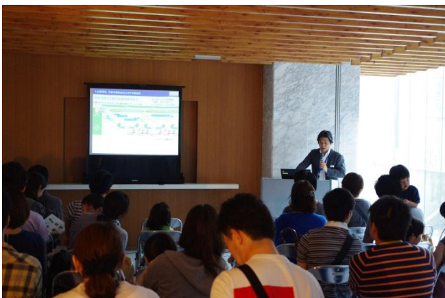
生態系配慮型植栽維持管理体制のご説明