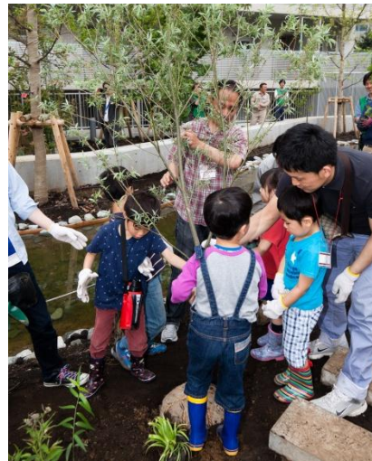
中木の植樹の様子