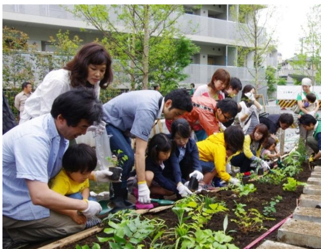
植樹をする入居予定者たち

普段は土に触れる機会があまり無い参加者の方たちも、スタッフのアドバイスを受けながら植樹を楽しまれていました。また、入居予定者同士で交流する場面も見受けられました。