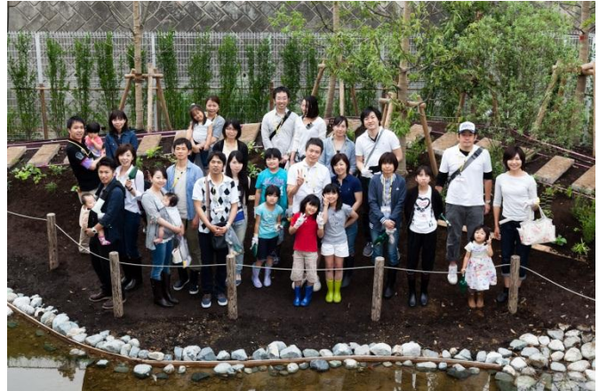
参加者の皆様で記念撮影