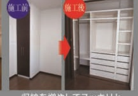
収納を増やしてスッキリと

※ご依頼いただいたお住まいの構造・形状・仕上・大きさより対応できない場合、もしくは別途費用がかかる場合がございます。※ご依頼いただいたお住まいの所在地により対応出来ない場合がございます。※上記設備写真はメーカー参考写真となります。※上記設備メーカーが変更になる場合がございますのであらかじめご了承ください。