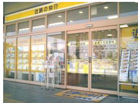
近鉄の仲介 登美ヶ丘営業所