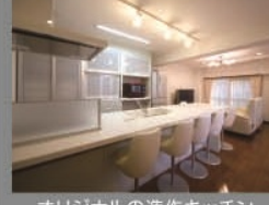
オリジナルの造作キッチン