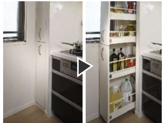
2段式スライド収納

2段式スライドなので奥の収納物も一目でわかり、 手前の物を動かさずにサッと取り出せます。