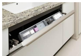
洗面ボールの化粧ポケット