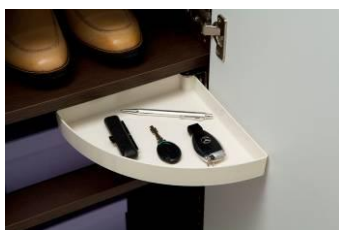
下足入れの回転式ラック

※「カタツク研究所＝カタ研(ラボ)」とは、多くの女性から寄せられた「収納」についての不満やアイデアを元にオリジナル収納を開発するために結成された近鉄不動産の開発チーム。