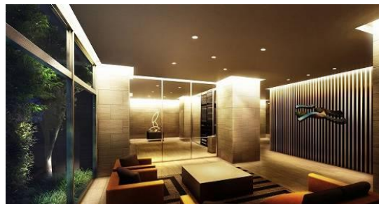
オーナーズラウンジ完成予想図