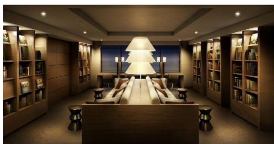
ライブラリーラウンジ完成予想図