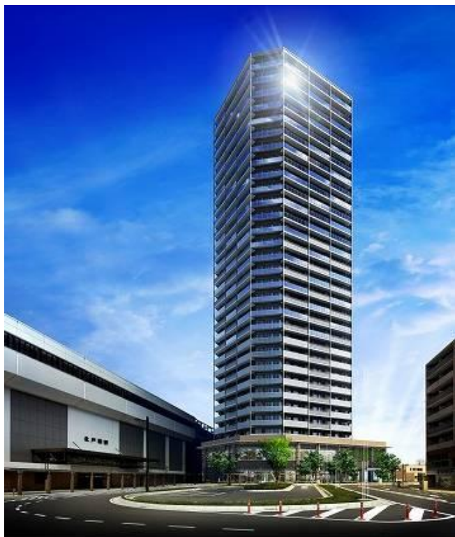
「北戸田ファーストゲートタワー」完成予想図