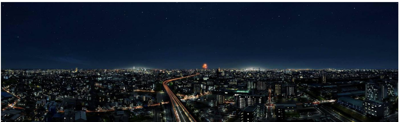
25 階相当の高さからの眺望(2011 年 5 月撮影 都心方面を望む)