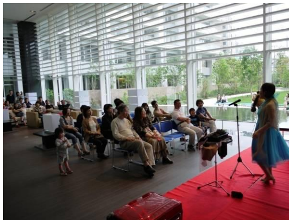
共用施設を利用したコンサート風景 (弊社導入済み物件の事例)

アロマ講習会/クリスマスパーティ/ヨガ体験/フラワーアレンジメント体験/夏祭り/子育て交流会 など