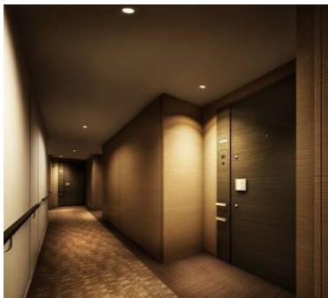
内廊下完成予想図