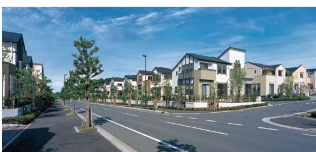
近鉄・柏ニュータウン ローレルヒルズ手賀の杜

千葉県・柏市に誕生した開発総面積約49haの大規模ニュータウン「ローレルヒルズ手賀の杜」をはじめとする都市型戸建住宅事業では、良質な住宅の供給と豊かなコミュニティの形成の支援を行っています。