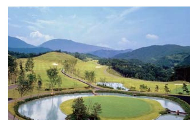
花吉野カンツリー倶楽部

心の豊かさが求められる時代に合わせて、余暇時間の過ごし方がますます重要視される中、私たちはあわただしい毎日から心身を解き放ち明日への鋭気を養う場として、優良なコースを整えたゴルフ場やホスピタリティあふれるホテルを開設。これからの時代のレジャーライフを提案しています。