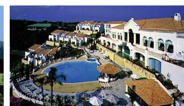
プライムリゾート賢島