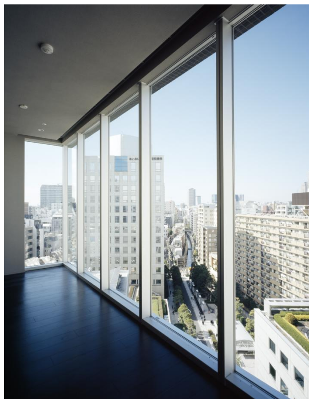
キャンティレバー